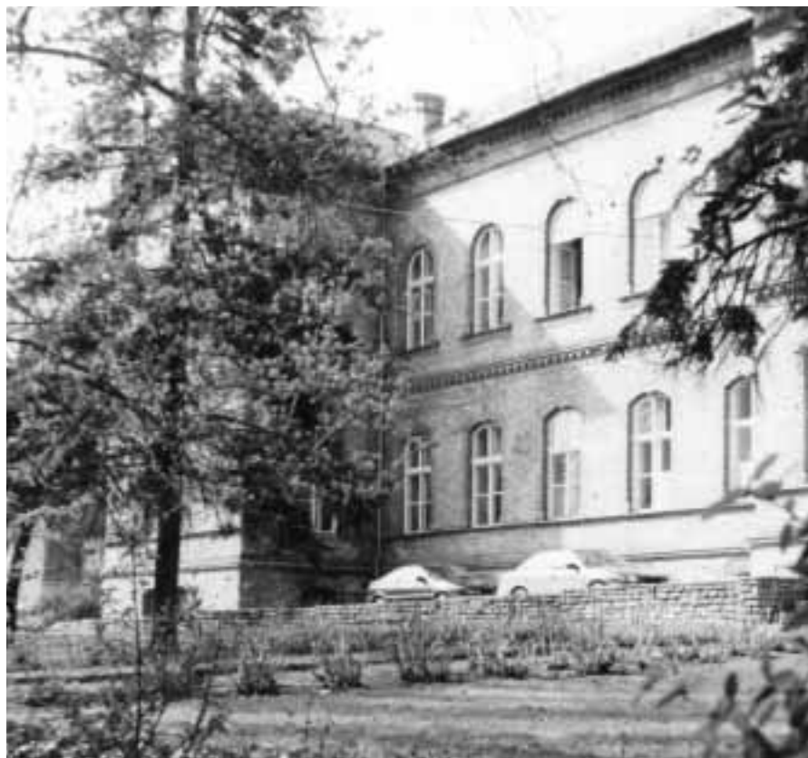
A címlapon a Sebészet épülete látható

Megalakult a Budai Emésztőszervi Centrum .....14